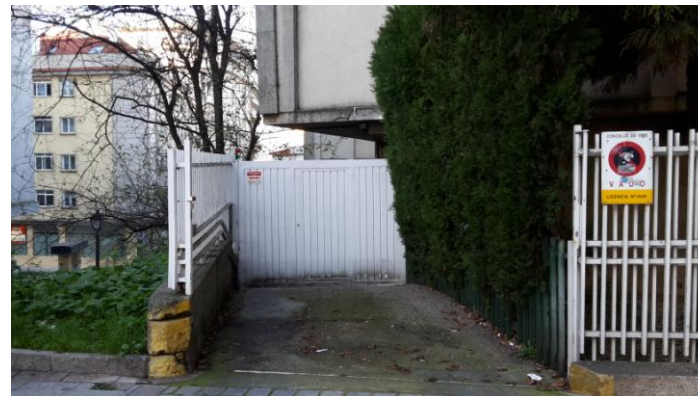
Garaje cerrado, C/Torrecedeira 88